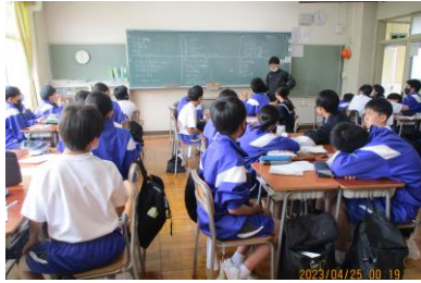
1年1組 学活です。クラス目標を決めています。