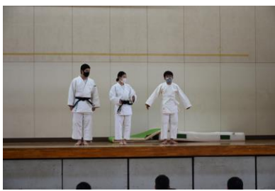
新入部員は募集しない柔道部も頑張りました