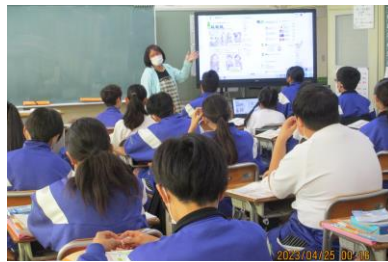
1年4組 英語です。デジタル教科書を使って英語での自己紹介を学んでいます。