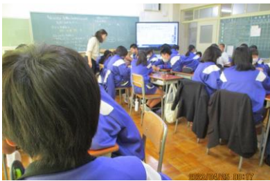
1年3組 理科です。生物のなかま分けを班で取り組んでいます。