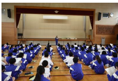
生徒会役員の説明

代表生徒たちの態度、伝える力にも感心します。2年間、南中学校で経験してきたことが実を結んでいることを、このオリエンテーションでも証明してくれました。1年生は安心して部活動等を選ぶことでしょう。