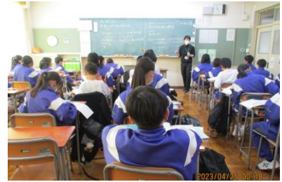
1年2組 数学です。負の数を伴う減法の学習です。