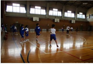
支援級 体育です。バスケットボールをしています。