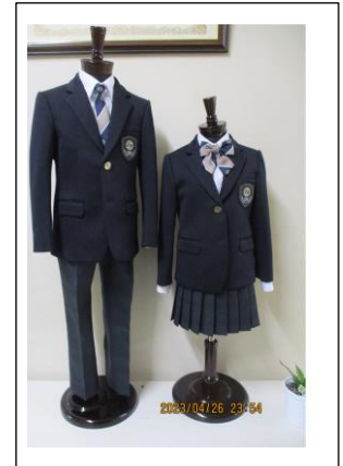
新標準服のミニチュアが届きました。今は校長室前に飾ってあります。