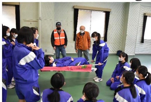
※この様子は 5/23 神奈川新聞の記事になります。

もしもの時には、多くの中学生が地域の皆様と協力して、活躍してくれることを期待しています。